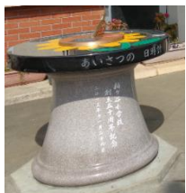
あいさつの日時計