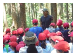
スタッフさんの話