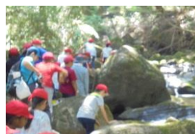
寒沢の源流を訪ねて