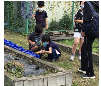
【花の水やり・3年生】

そして、8時のチャイムが鳴ると昇降口前で並んで待っていた児童たちが、一斉に校舎内に吸い込まれていきます。私は、毎朝正門で児童を迎えながら、その様子を見ていますが、それはまるで柏ヶ谷小学校という巨大ないきものが、エネルギーを吸収して一気に体を動かし、活動を始めているような姿に映ります。花に水やりをする児童が勢いよく昇降口から駆け出していきます。ウサギの世話をする児童が数人ウサギのケージに集まってきます。