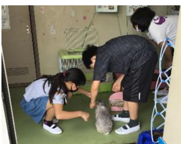
【うさぎの世話・飼育委員】

の『はじまり』に心から感謝したい気持ちになります。そして、まだ先が見通せず、さまざまな心配もありますが、明日もまた、無事に一日がはじまりますように・・・と願うのです。