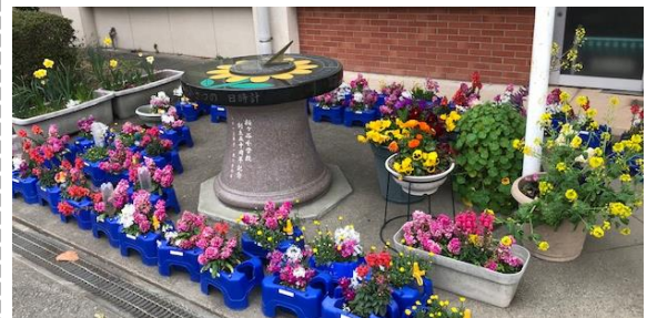
【あいさつの日時計と3年生栽培の花々】