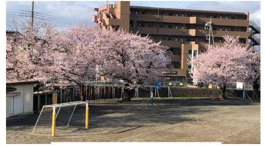
【校庭南側 満開の桜】

その中の <めざす児童像>みんな柏っこ については、令和3年度の1年間をかけて、児童と共に考え、決定したものです。校内、各教室等に掲示すると共に、入学式、始業式等、さまざまな機会において周知を