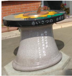
あいさつの日時計